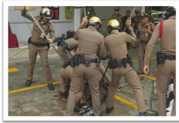
ตัวอย่างการใช้ไม้ง่ามในการควบคุมคนร้าย

2.2.3 ปฏิบัติการตามยุทธวิธี กรณีจำเป็นเร่งด่วน ให้เข้าระงับเหตุตามลำดับการใช้กำลัง โดยพิจารณาความเหมาะสมตามสัดส่วน ตามสถานการณ์และพฤติกรรมของคนร้าย และสภาพแวดล้อม