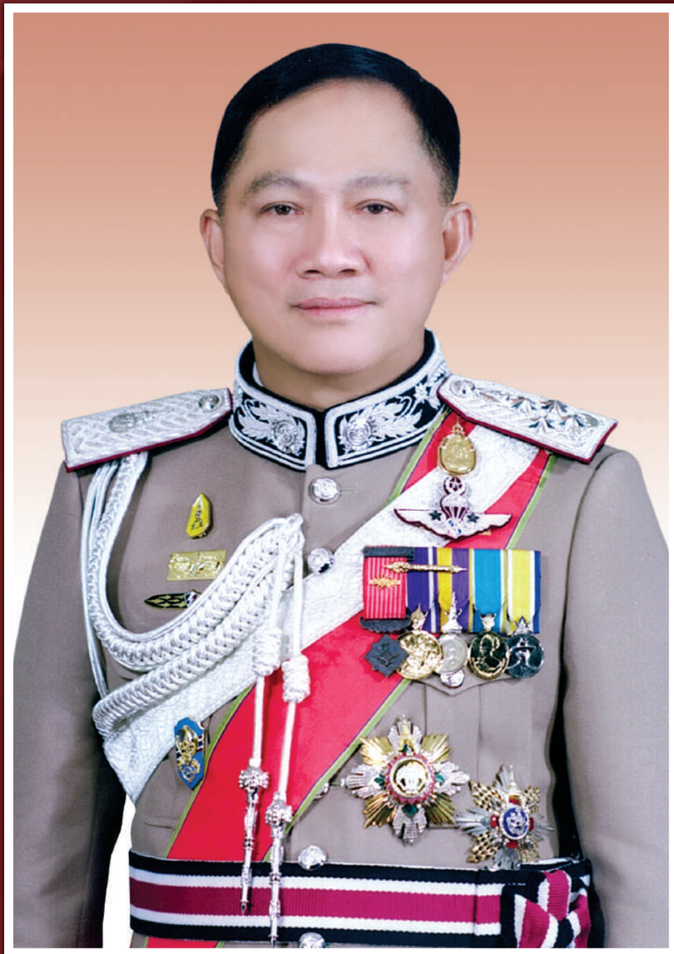
พลตำรวจเอก อุดุลย์ แสงสิงแก้ว ผู้บัญชาการตำรวจแห่งชาติ